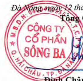
Đinh Châu Hiếu Thiện