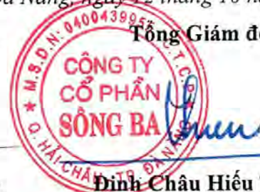
Đinh Châu Hiếu Thiện